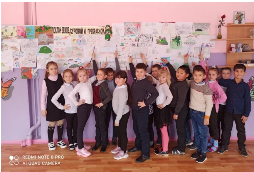
Война в Афганистане – самый известный и

Желаем всем только мирных дней и добрых вестей, солнечного неба над головой и спокойствия в каждый дом.